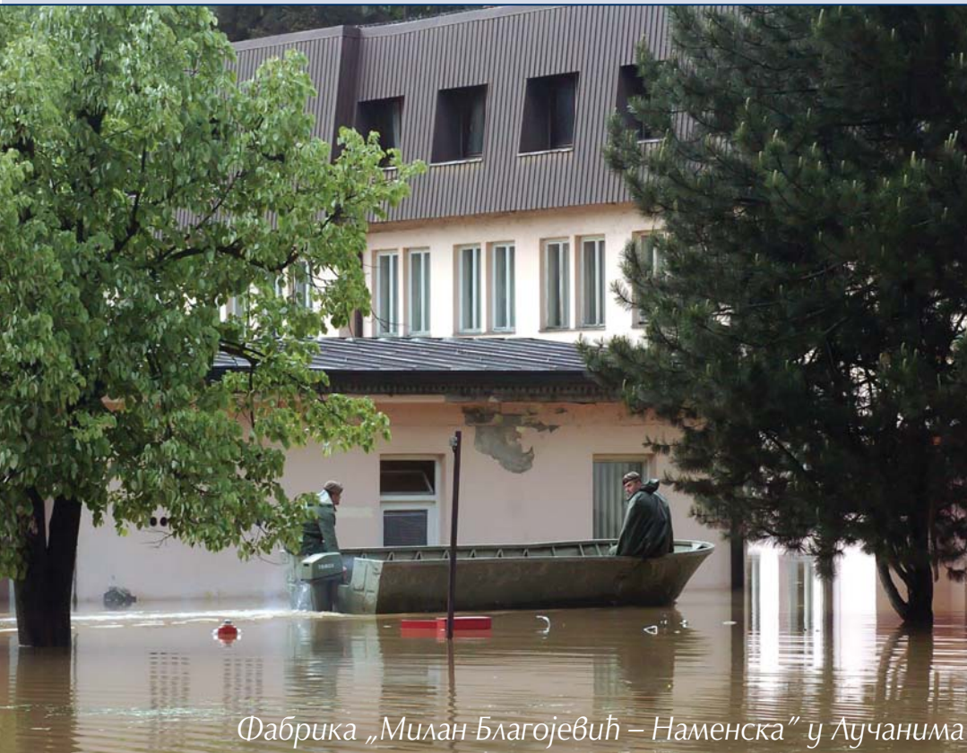
Фабрика „Милан Благојевић – Наменска“ у Лучанима

Од привредних друштава из групе одбрамбена индустрија Србије, поплаве су погодиле два компаније – „Милан Благојевић – Наменска“ АД Лучани и „Прву искру – Наменска производња“ АД Барич. Осталих пет предузећа није претрпело штету и производња се у њима одвија несметано.